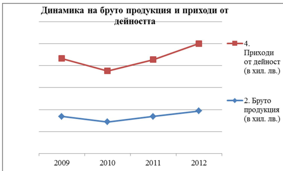
Фиг. 7и 8: Динамика броя на фирмите, заетите и приходите от дейност

Средната годишна номинална заплата в общината (вж. таблица 26) за периода 2009 – 2012 г. показва нарастване, което не е съизмеримо с нарастването на приходите, респективно на печалбите. Ясно се вижда нарастване на заплатите дори и през 2010 година. Това нарастване се дължи на факта, че през 2010 година имаше нарастване на праговете минимална работна заплата и минималните осигурителни прагове. През 2011-2012 г. заплатите нарастват съобразно нарастването на приходите. Наблюдава се тенденция за по-високи заплати в общественния сектор, спрямо частния, което е негативно за развитието на бизнеса.