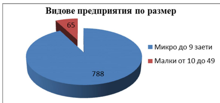
Фиг.6 Видове предприятия по размер

Икономическото развитие през последните години, въпреки световната финансова криза очертава положително развитие в община Първомай. Към края на 2012 г., регистрираните стопански субекти в Общината са 869, от които микро- до 9 заети – 788, малки – от 10 до 49 заети – 65 предприятия. Ясно се вижда доминиращото влияние на микропредприятията. Това е признак за гъвкавост от една страна, но от друга няма водещи средни и големи предприятия, които да осигурят стабилна заетост и солидна добавена стойност.