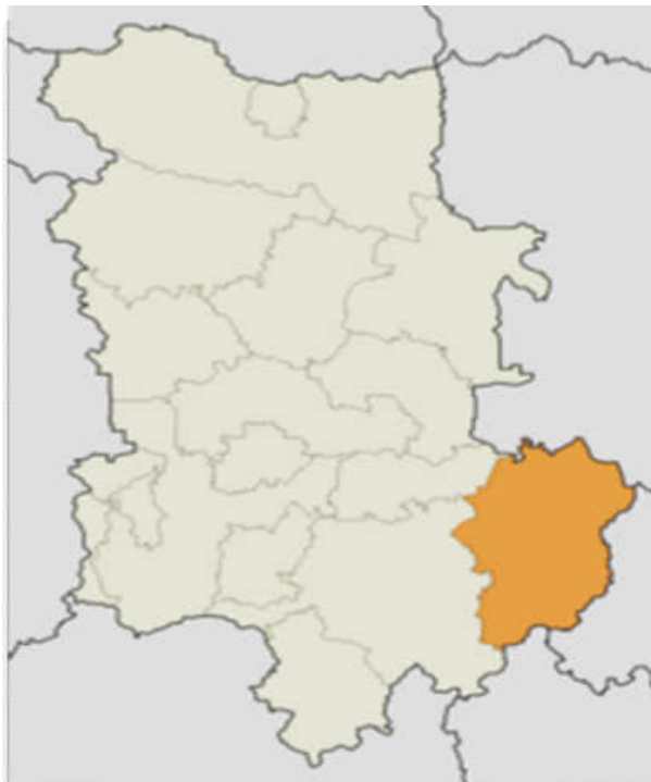
Фигура 1. Разположение на община Първомай в територията на област Пловдив

Територията на община Първомай включва 17 населени места и граничи с общините Братя Даскалови и Чирпан на север, Димитровград и Минерални Бани на изток, Асеновград и Садово на запад, а на юг с община Черноочене. Община Първомай обхваща 8.94% от територията на пловдивска област.