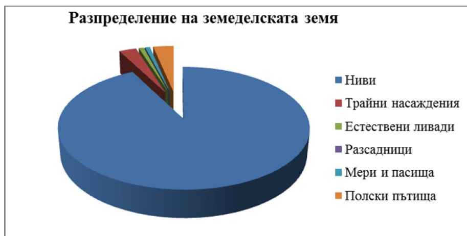
Фиг. 10 – Разпределение на земеделската земя по фондове

Висок е дялът на обработваемата земя в общината - тя заема около половината от територията.